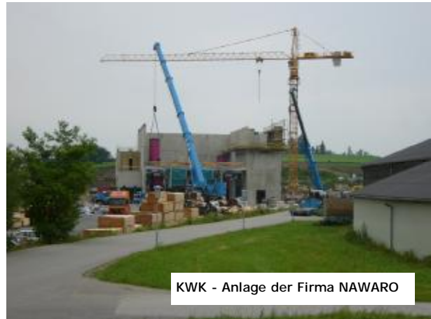
KWK - Anlage der Firma NAWARO

Auch die Kraft – Wärmekopplungsanlage der Fa. Nawaro auf dem Betriebsgelände der Fa. Steininger wächst.