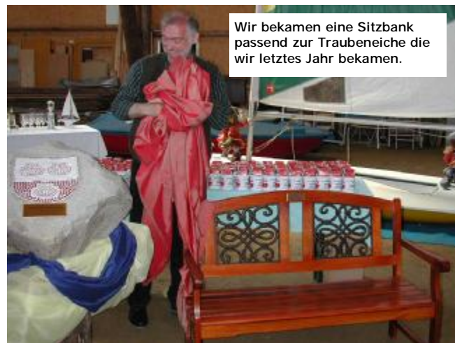
Wir bekamen eine Sitzbank passend zur Traubeneiche die wir letztes Jahr bekamen.