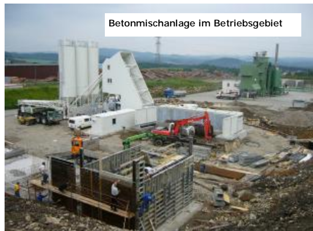
Betonmischanlage im Betriebsgebiet

Die Fa. Asphalt und Beton (Tochterfirma der Strabag AG) hat die Bewilligung für die Errichtung einer Betonmischanlage neben der Asphaltmischanlage bekommen und den Bau fast abgeschlossen .