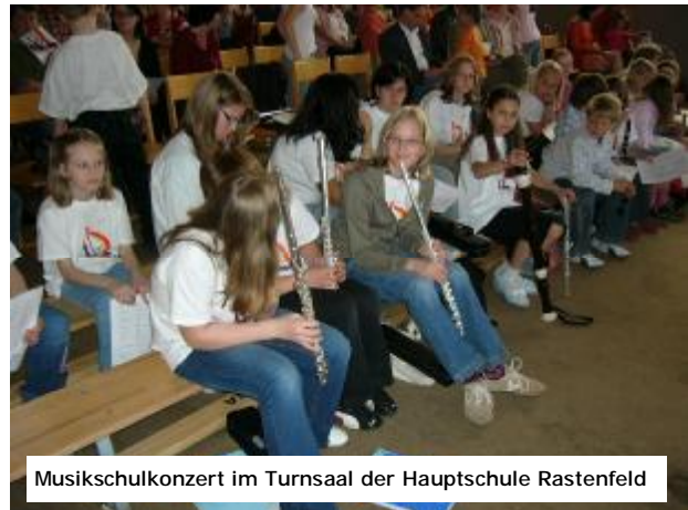
Musikschulkonzert im Turnsaal der Hauptschule Rastendorf