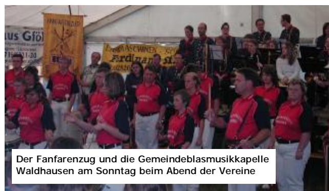
Der Fanfarezug und die Gemeindeblasmusikkapelle Waldhausen am Sonntag beim Abend der Vereine