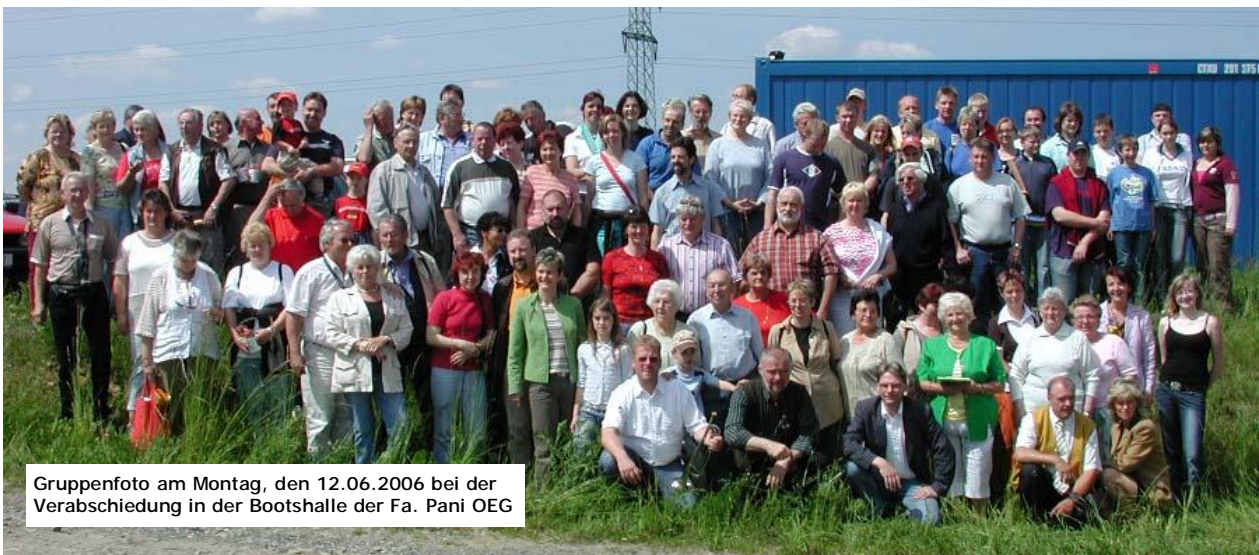
Gruppenfoto am Montag, den 12.06.2006 bei der Verabschiedung in der Bootshalle der Fa. Pani OEG

Weiters stand auf dem Programm noch: Vernissage der Ausstellung „Auf Schatzsuche“ ...näher hin ´gshaut...; Besichtigung der Firma Waldland (Leinenhaus in Rastendorf und Waldlandhof in Oberwaltenreith); Führung Döllersheim; Heurigenbuffet mit musikalischer Umrahmung im Schloss Waldreichs; Besichtigung Windhagsche Stipendienstiftung für NÖ - Forstamt Ottenstein; Musikschule Rastendorf; Besichtigung NAWARO (Kraft-Wärme-Kopplung-Biomasseanlage) beim Betriebsgebiet Steininger Sägewerk sowie Firma Pani OEG. Wir freuen uns jetzt schon auf das Treffen im nächsten Jahr (September 2007).