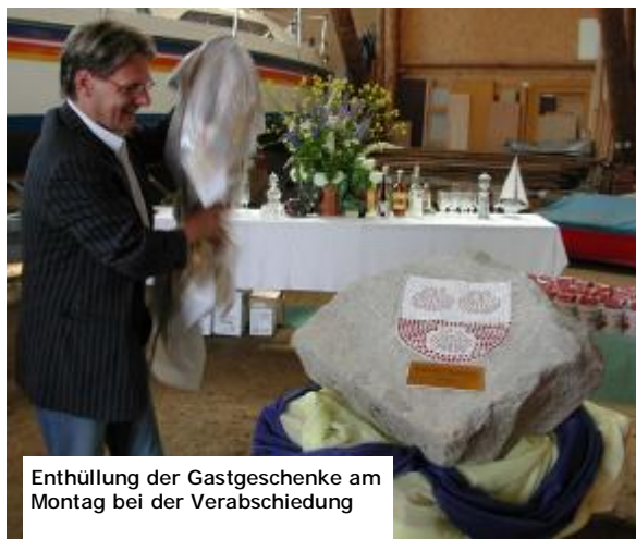
Enthüllung der Gastgeschenke am Montag bei der Verabschiedung