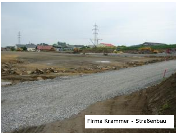
Firma Krammer - Straßenbau

Im Betriebsgebiet gehen die Baufortschritte bei der Bauplatzgestaltung der Fa. Krammer und beim Straßenbau der Gemeinde zügig voran.