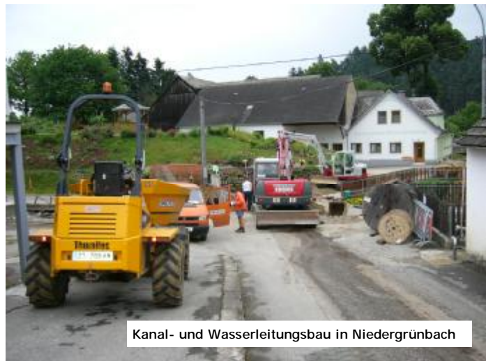
Kanal- und Wasserleitungsbau in Niedergrünbach

Die Straßenwiederherstellungen werden das Budget auch zusätzlich belasten, da sich beim Bau herausstell-