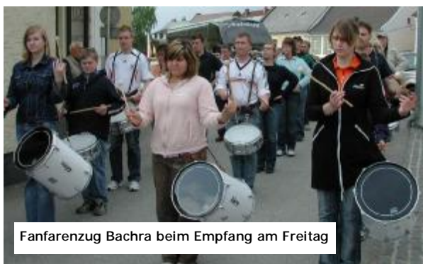
Fanfarezug Bachra beim Empfang am Freitag