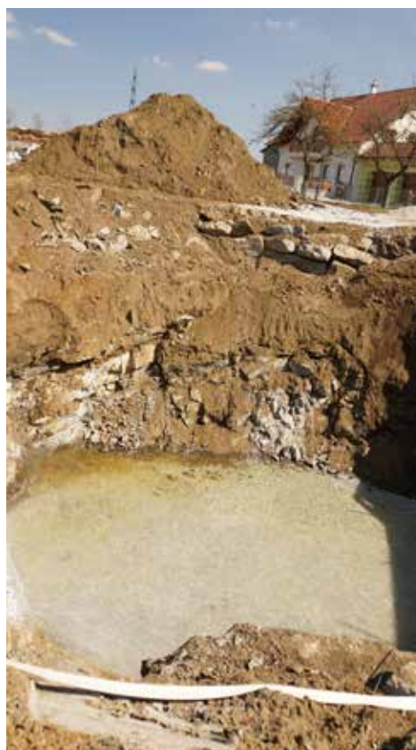
Foto: Baugrube Retentionsbecken Gruber

Mit dem Bau des Regenwasserkanals und dem Retentionsbecken (Löschwasserbecken) im Bereich der Liegenschaften KFZ Gruber / Kröpfl / Einbeck (Rastendorf) wurde bereits begonnen. Durch diese Maßnahme wird auch dieser Bereich eine ordnungsgemäße Ableitung der Oberflächenwässer haben.