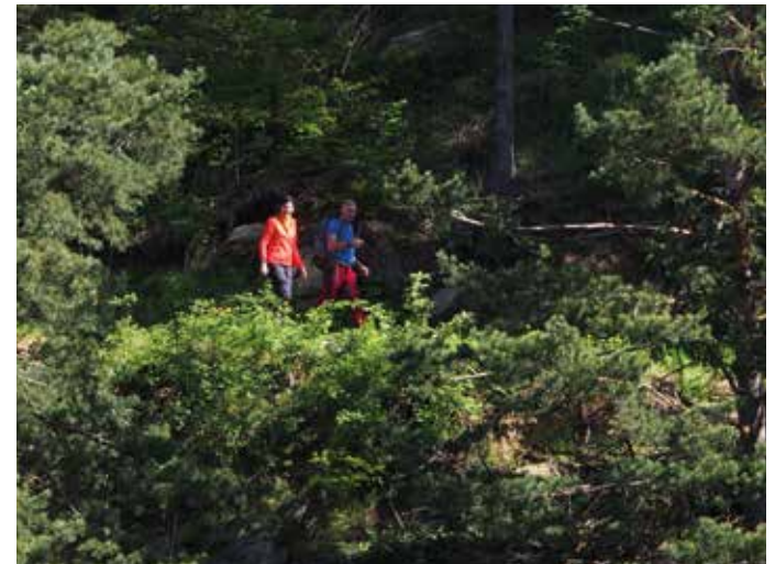
04/05 Bewegung ist unsere Natur.

In Rastensfeld ist kein Tag wie der andere - hier kann man mitten in der Waldviertler Landschaft herrlich golfen, umrahmt von Naturschönheiten wandern, über dem Wasser klettern oder einfach die Seele baumeln lassen.